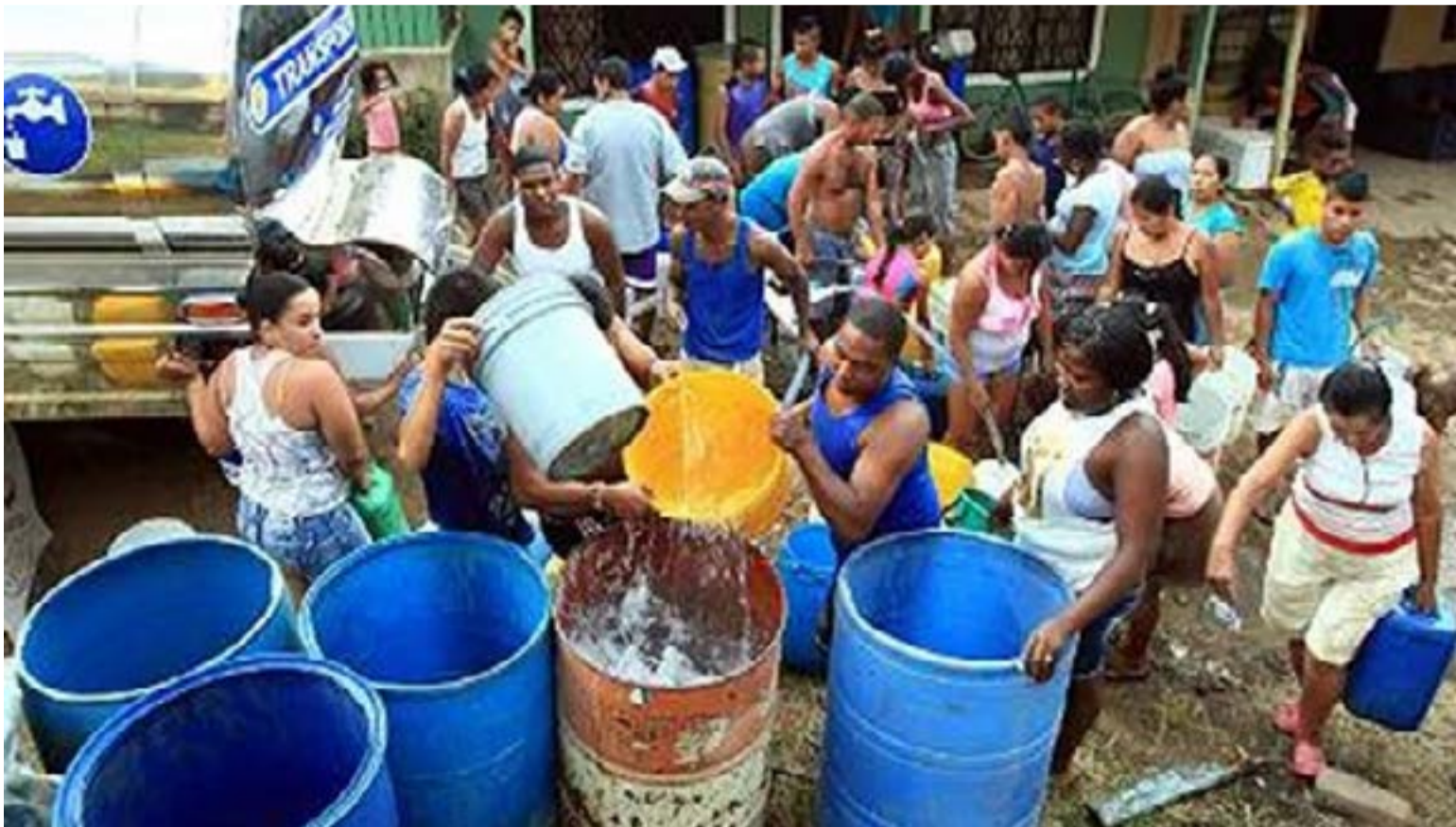
Buenaventura desde hace 100 años carece de un buen servicio de acueducto y alcantarillado.

El Gobierno aprueba más de $43.000 millones para transformar el acueducto y el alcantarillado de Buenaventura, un reclamo histórico del Paro Cívico.