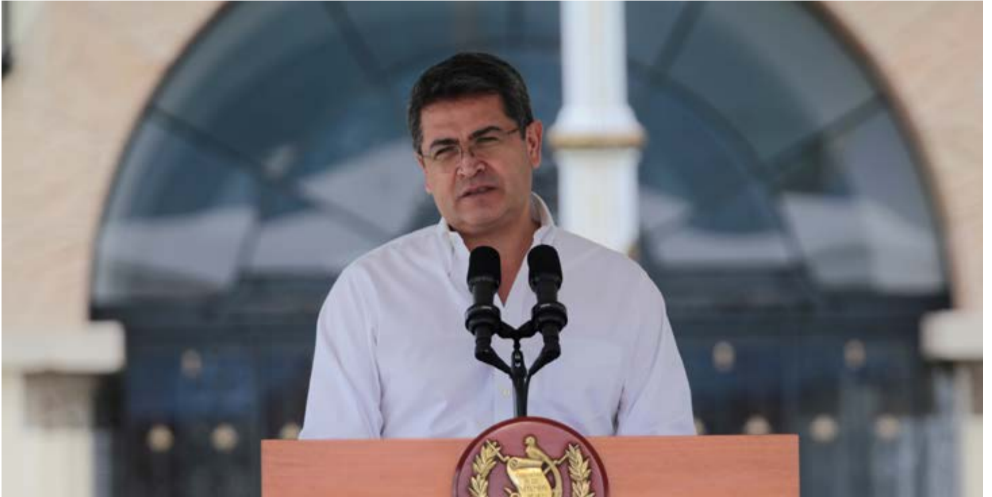
Audios filtrados del expresidente hondureño Juan Orlando Hernández revelaron su presunta confesión sobre una operación transnacional para desestabilizar gobiernos progresistas. Este hallazgo sustenta la denuncia del presidente Petro sobre una «guerra sucia» y un complot internacional, denominado «Honduras Gate», financiado desde Miami para destruir la imagen de su administración.

desinformativa se articuló a través de tres operaciones interconectadas entre sí, bautizadas por los estrategas criminales como Operación Ajax, Operación Júpiter y Operación Honduras Gate.