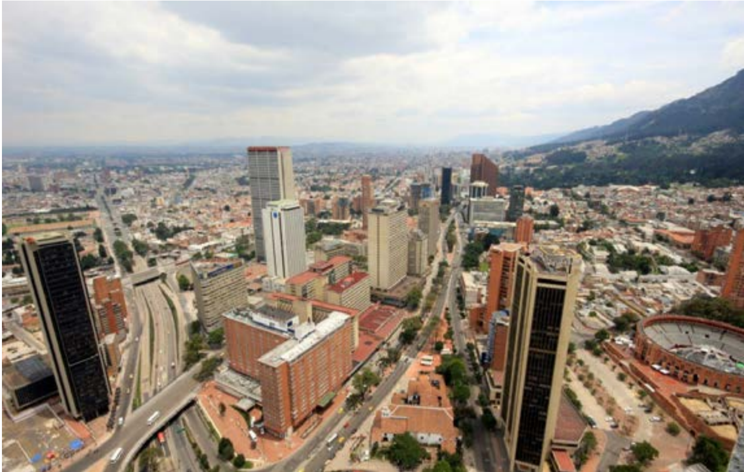
Es humanamente imposible cumplir con los horarios e informes de tres o más contratos simultáneos en entidades distintas de la Alcaldía. Esta irregularidad administrativa sugiere que quienes pagamos impuestos en Bogotá podríamos estar financiando «contratos fantasma» o aprobando certificaciones de cumplimiento a ciegas.

denuncias. Más allá del evidente favorecimiento político o el beneficio económico personal, el debate de fondo es el nulo control sobre los productos contratados. Resulta humanamente imposible que un solo profesional cumpla con las intensidades horarias, reuniones, informes técnicos y obligaciones pactadas en tres o más contratos vigentes con entidades distintas de la Alcaldía Mayor, lo que sugiere que el Distrito podría estar pagando por «contratos fantasma» o entregando certificaciones de cumplimiento a ciegas.