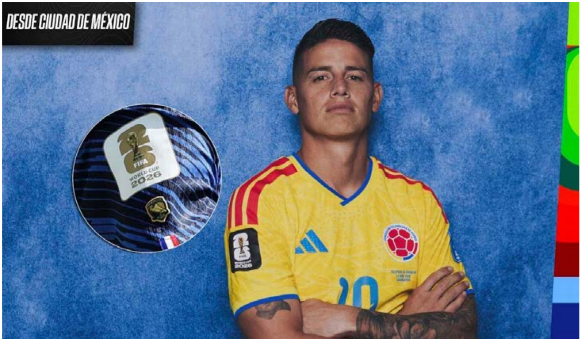
James Rodríguez debutará en el Mundial 2026 con una camiseta única equipada con un parche exclusivo de la FIFA. Este distintivo dorado reconoce su histórico legado en el torneo como ganador de la Bota de Oro en Brasil 2014.