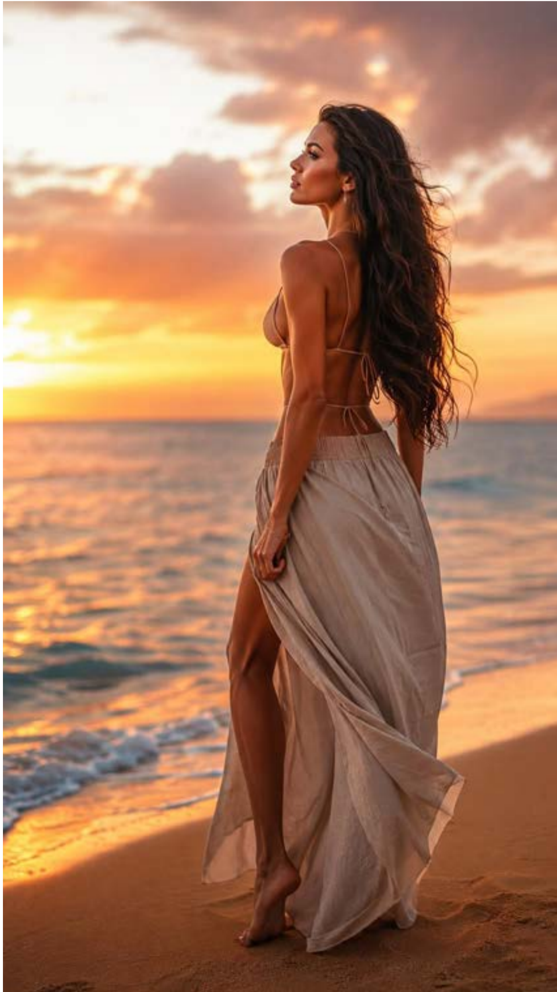
El look perfecto para el atardecer

El Éxito en la Era Digital: La gran fortaleza del formato actual es su exitosa adaptación al universo del