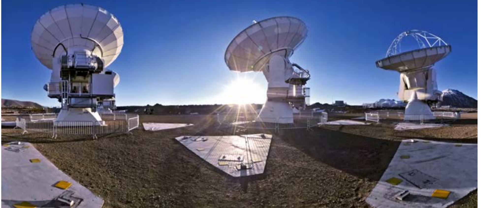
Panorama de 360 grados de la llanura de Chajnantor repleta de imponentes antenas tecnológicas. El árido paisaje destaca bajo un cielo azul profundo y un sol radiante que ilumina el desierto chileno.