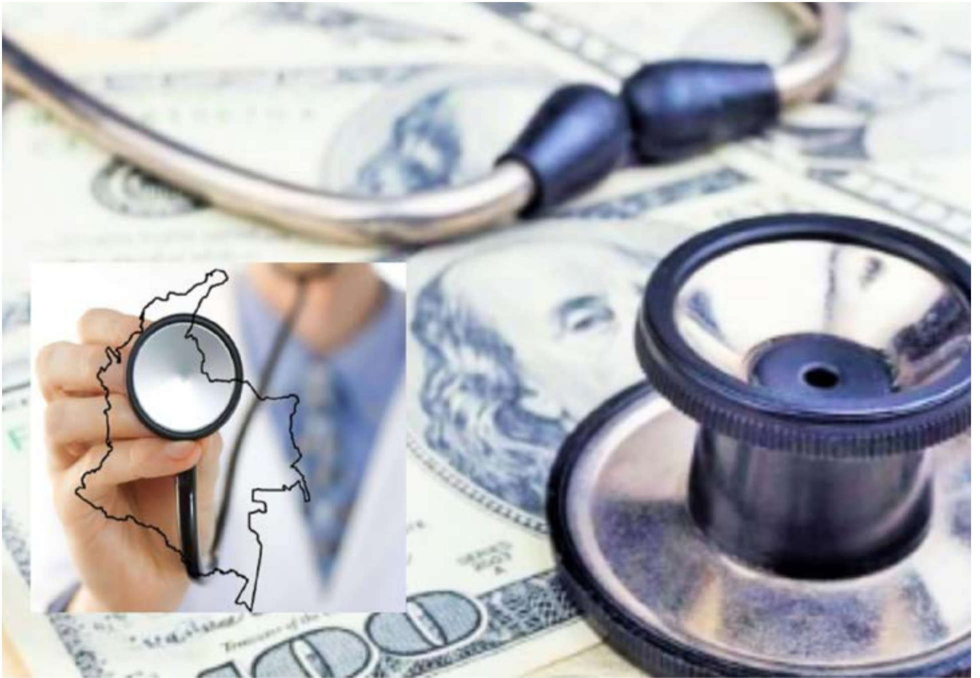
$5 billones de la salud colombiana fueron desviados hacia fondos internacionales

detrás de la operación se encuentra uno de los mayores distribuidores farmacéuticos del país, cuyos contratos globales rozan los 35 billones de pesos.